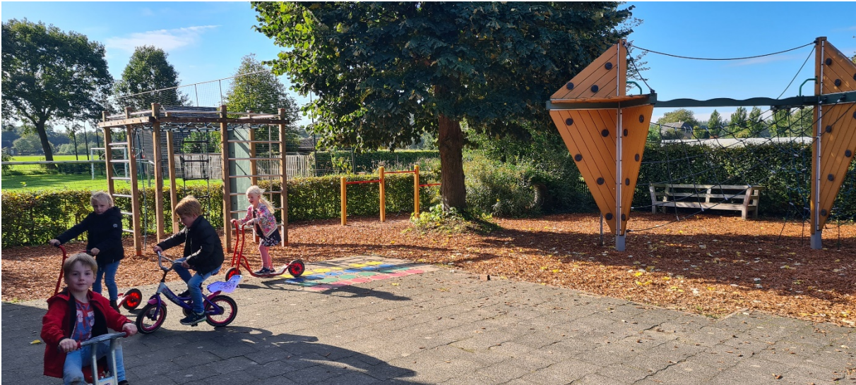
Het schoolplein zorgt voor veel uitdaging, natuur en spel tijdens het overblijven