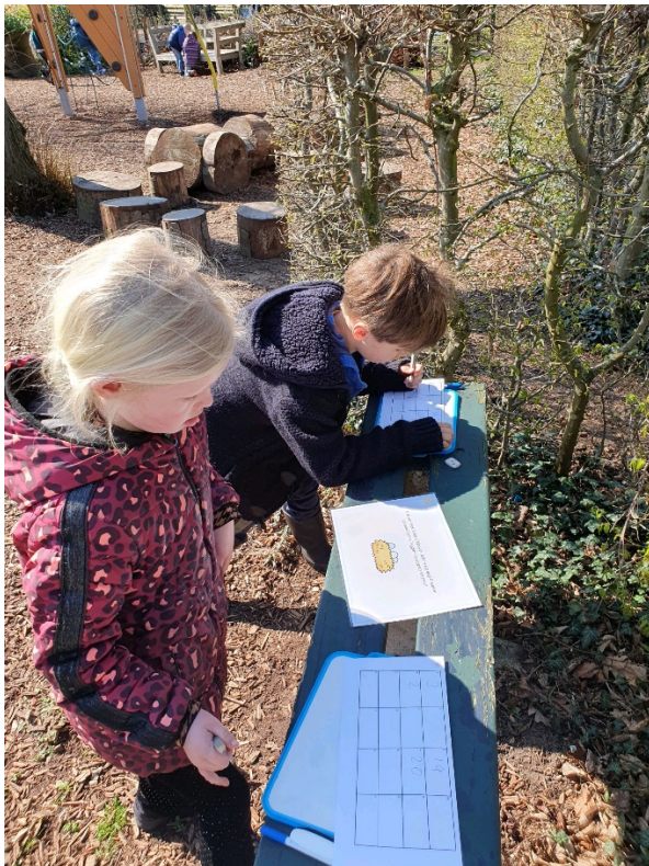
Onze groene omgeving wordt optimaal benut

De groepen 6,7 en 8 gaat vier keer per jaar naar het technieklokaal in Doetinchem, waar kinderen aan de slag gaan met zaken die betrekking hebben op onder andere metaal, elektrotechniek, installaties en bouw.