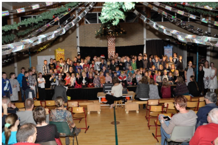
Tijdens de kerstmusical had elke leerling een rol

Om vele redenen (sociaal-emotionele ontwikkeling, omgaan met verschillen, schoolklimaat, actief en samenwerkend leren) vinden wij het belangrijk, dat we samen vieren en dat we er samen op uit trekken. De kinderen worden daarbij regelmatig in gemengde groepen (1 t/m 8) ingedeeld. Om dezelfde reden hebben ook alle leerlingen gelijktijdig pauze en kunnen ze allemaal gebruik maken van het hele speelterrein.