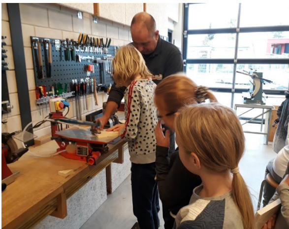
Naast het technieklokaal worden lokale bedrijven bezocht, waaronder de smederij in Vorden

Bij het veranderen van school: Voor kinderen die voordat ze het einde van groep 8 bereiken de school verlaten, wordt t.b.v. de ontvangende school een rapport opgesteld. Dat rapport bevat o.a. gegevens over vorderingen en toetsresultaten van het kind, over de gebruikte methodes en over speciale kenmerken van het kind (bijzonderheden, medicijngebruik, werkhouding enz.).