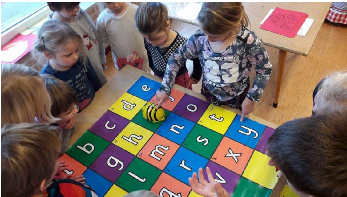
De school besteedt ook aandacht aan programmeren. Hier werken kinderen met de programmeerbare schildpad.

Het voordeel van het werken op het chromebook is, dat de kinderen meteen feedback krijgen of ze de som goed uitrekenen of niet. Het kan ook zijn dat zij als feedback nog een extra instructie krijgen.