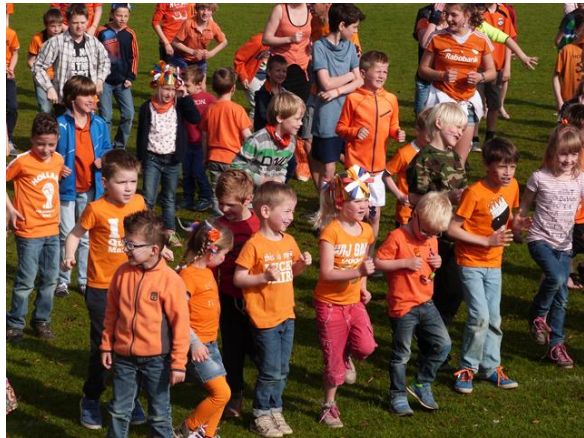
Sport en spel tijdens de Koningsspelen

Buiten schooltijd doen we mee aan evenementen die door plaatselijke verenigingen worden georganiseerd, bijv. schoolvoetbal.. Onze school heeft ook het keurmerk Gezonde School op het gebied van Sport en Bewegen.