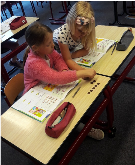
Aan het werk in de klas.