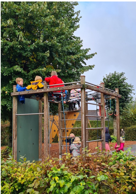
Er zijn diverse speeltoestellen op het schoolplein

We hechten veel belang aan een gezond binnenklimaat. Daarom is er in 2022 een goed ventilatiesysteem aangebracht in school.