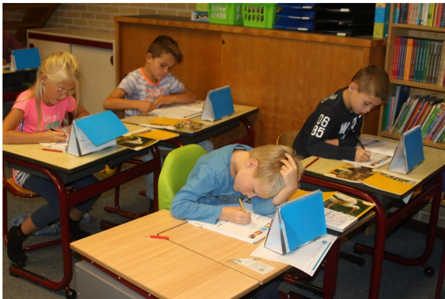
De kinderen maken opdrachten van een spellingsles.

Soms is het vereist, dat eerst de eigen verzekering wordt aangesproken, voor er een beroep kan worden gedaan op de schoolverzekering (bijv. bij Wettelijke Aansprakelijkheid). Voor de gymzaal en de inventaris van de gymzaal loopt een afzonderlijke verzekering.