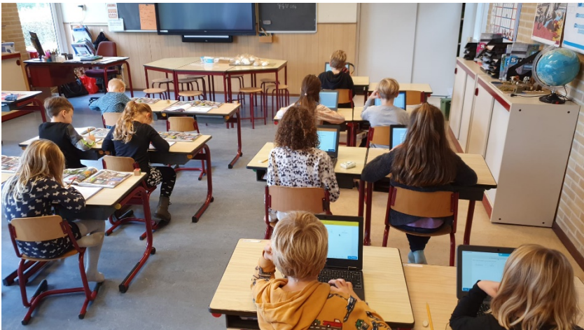
Vanaf groep 5 werken de kinderen ook met chromebooks.