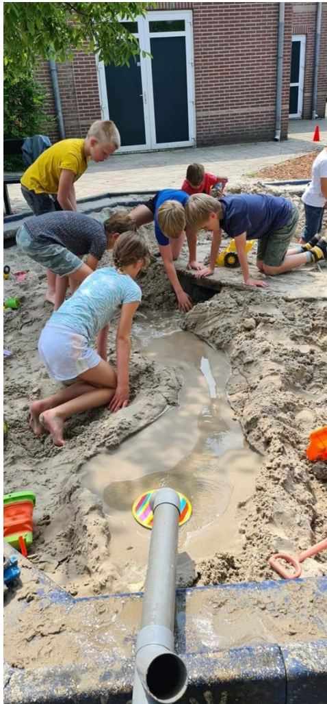
Grote en kleine kinderen spelen samen in de pauzes"