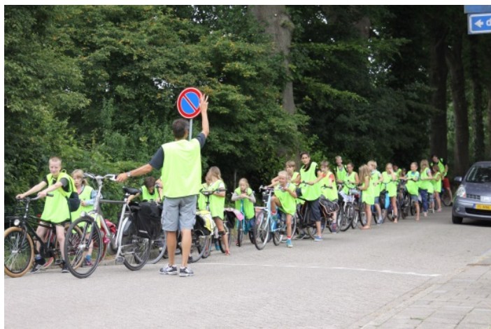
Kinderen fietsen met veiligheidsvestjes aan naar het zwembad

Om het aantal auto's bij school te beperken, vinden we het prettig, als kinderen zoveel mogelijk met de fiets komen. Stap altijd af voor je met de fiets de stoep op gaat. In de donkere periodes vergroten veiligheidshesjes de zichtbaarheid van de kinderen.