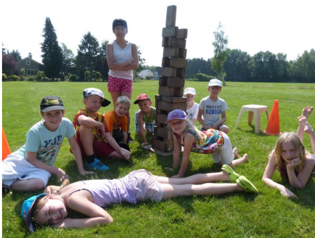
Samen vieren met sport en spel tijdens het Medlerfeest

Direct contact vindt plaats tijdens het dagelijks brengen en halen van de kinderen. Aan het begin van het schooljaar organiseert de school een voorlichtingsavond voor de ouders in de groepen. Voor de tien-minuten-gesprekken worden alle ouders uitgenodigd. Verder zijn ouders steeds van harte welkom om over de ontwikkeling van hun kind met de leerkracht te praten. Naarmate de problematiek indringender wordt, is het belangrijker om vooraf een afspraak te maken. Het initiatief voor zo'n gesprek kan ook van de leerkracht uitgaan.