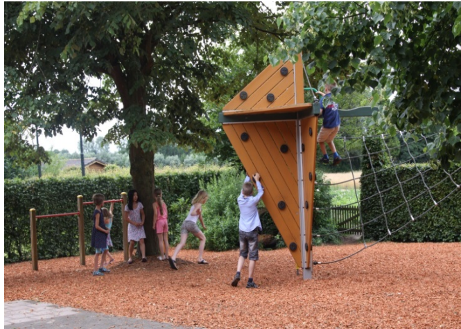
Speeltoestel voor de oudere kinderen

Bij aanvang van schooljaar 2023-2024 telt de school 62 leerlingen. Wij denken dat we de komende vier jaar redelijk stabiel blijven.