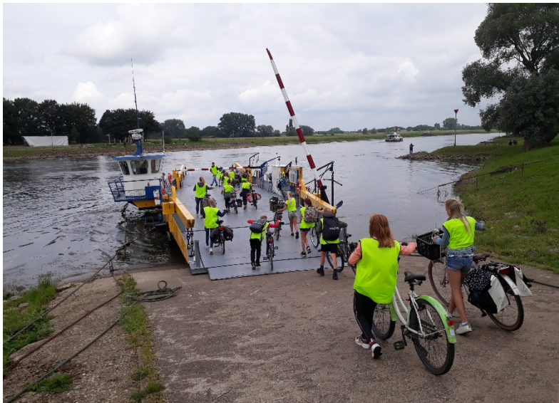
Groepen 7 en 8 gaan op kamp

Het rijk vergoedt de gangbare kosten voor het onderwijs. Een accountant controleert jaarlijks de inkomsten en uitgaven van de school. De Stichting beschouwt zichzelf als financieel gezond.